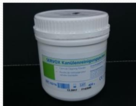
Limpiador en polvo – cánulas 400 gr.