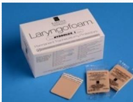
Filtro espuma LARYNGOFOAM