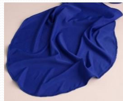
Pañuelo Azul Real