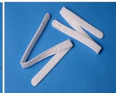
Cinta sujeción para BUCHANAN DELTANEX