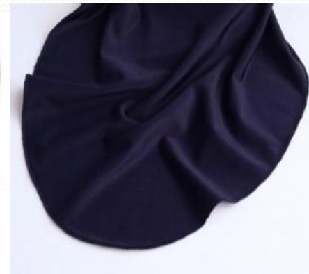
Pañuelo Azul Marino