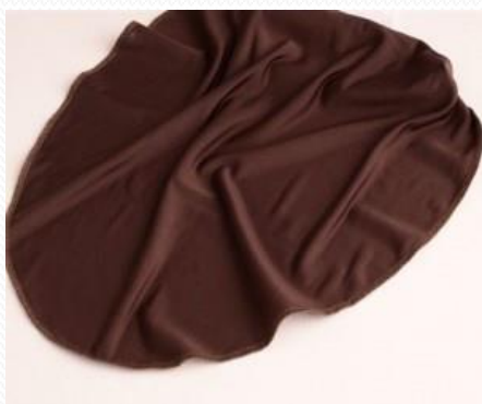
Pañuelo Nuez Moscada