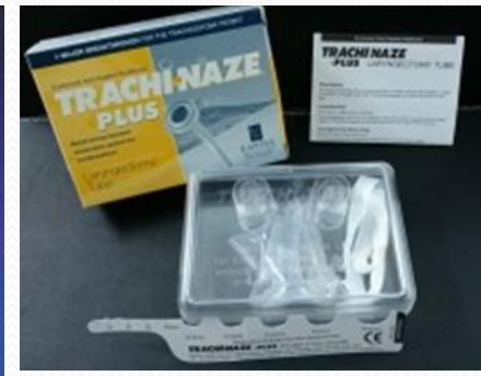
Accesorio Cánula laringectomía TRACH-NAZE PLUS