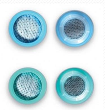
Filtro Día-Noche TRACHI NAZE PLUS