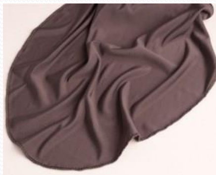
Pañuelo Gris Acero