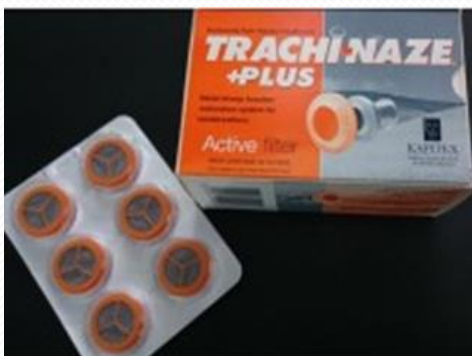
Filtros activos TRACHI NAZE PLUS