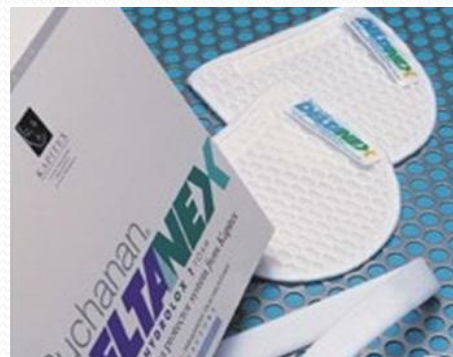
Protectores BUCHANAN DELTANEX