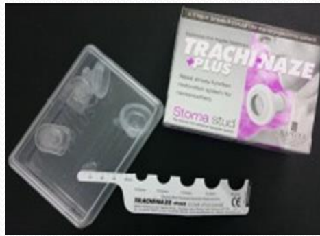
Accesorio STOMA STUD + 2 Protectores ducha. Dif.Ø