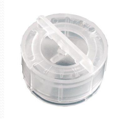
Válvula "Manos Libres" TRACHI-NAZE