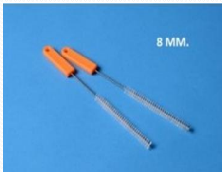
Cepillos limpia cánulas. 8,10,12,14 mm.Ø