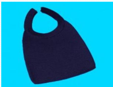
Cubre estomas ROMET Z