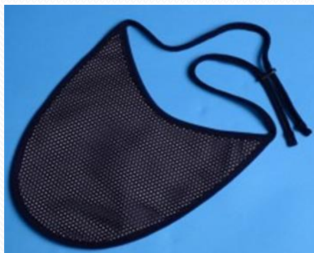
Protectores BUCHANAN LITE