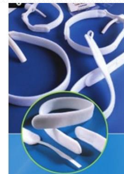
Soporte tubo traqueostomía TRACHI-HOLD