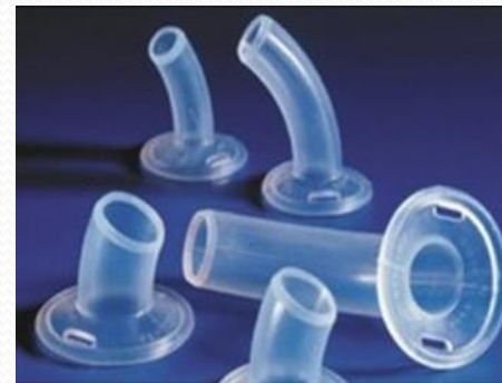
Cánulas de silicona