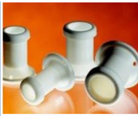
Hemicánulas STOMA STUD