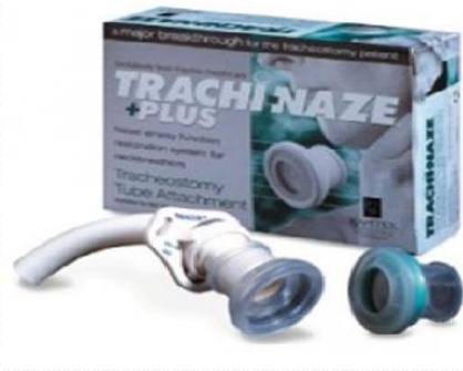
Sistema filtrado TRACHI-NAZE + PLUS